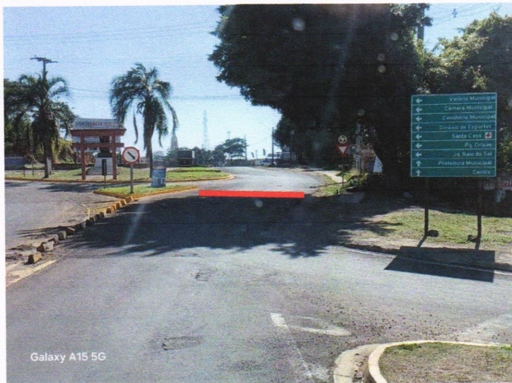
Trecho da Vicinal Vereador José Molina (sentido Centro da Cidade)