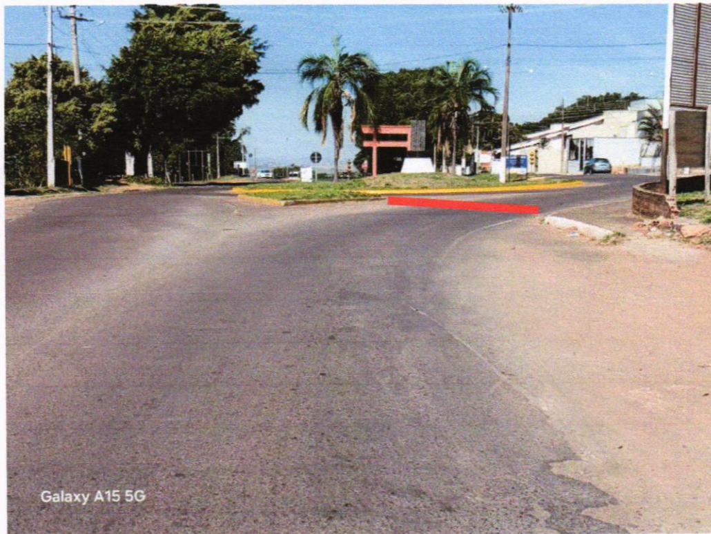
Trecho final da Rua Marcílio Dias (sentido Raposo Tavares), próximo à Rotatória Issei Matsumoto.