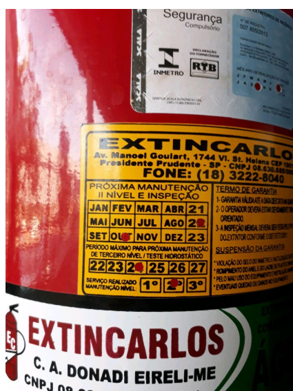
dentro da validade