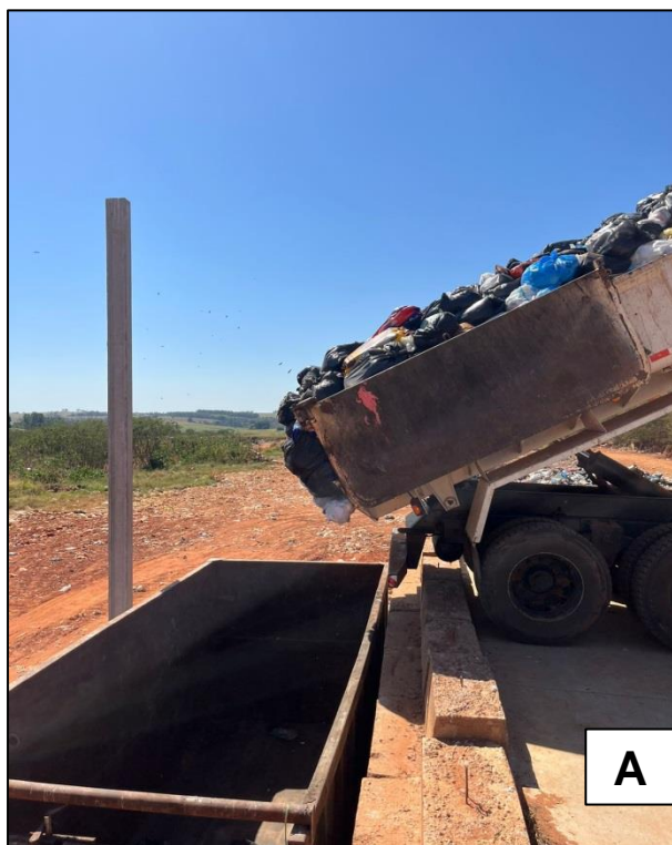
Imagem A e B: Área de transbordo e triagem de resíduos domiciliares. Na imagem (A) tem-se o caminhão da coleta de resíduos basculando na caçamba roll on - roll off para posterior destinação final em aterro. Na imagem (B) tem-se as caçambas estacionadas para receber os resíduos.